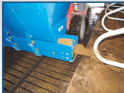
Typ AS (Frontanbau)