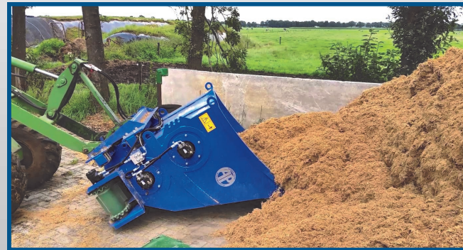
Typ ASM (Frontanbau)