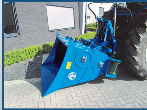
Typ ASM (Heckanbau)

AP Einstreugeräte sind multifunktionale Maschinen die unterschiedliche Produkte mit einem konstanten Streubild verarbeiten können. Der speziell entwickelte Förderband ist versehen mit einem Keilriemen um Schräglauf zu vermeiden. Daneben ist der Förderband ausgerüstet mit zwei aufrechten Seiten damit nur geringe bzw. keine Einstreu unter / zwischen dem Band geraten kann. Die Maschinen sind geeignet für sowohl Front- als Heckanbau da die Maschinen mit einem Anbaurahmen ausgestattet sind. Diese soliden Einstreugeräte werden vom Anfang bis zum Ende von uns gebaut, gesandstrahlt und versehen mit einem Primer und lackiert mit hochwertigem Zwei-Komponenten-Lack.