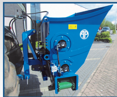
Typ ASM (Heckanbau)